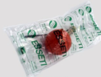
LDPE bag Confezione in polietilene

Available on request Disponibile a richiesta